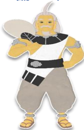
อาจารย์โทสะ