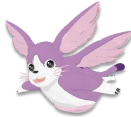
ตุ๊กเหมียว