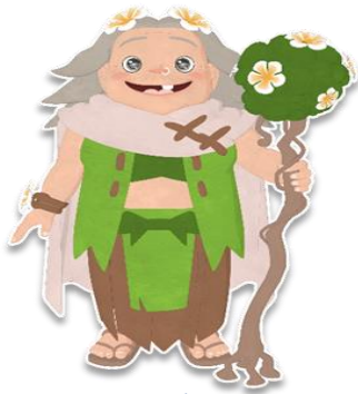
ยายเขี้ยว