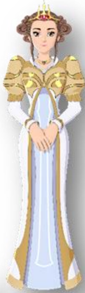
ตัวละครฝ่ายดี