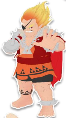
เจ้าตะขोजอมโหด