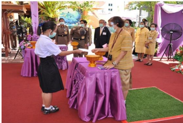
การพัฒนาคุณภาพการเรียนการสอนภาษาไทย