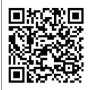
การเคารพสิทธิผู้อื่น ตอน เคารพสิทธิในชีวิต และร่างกาย