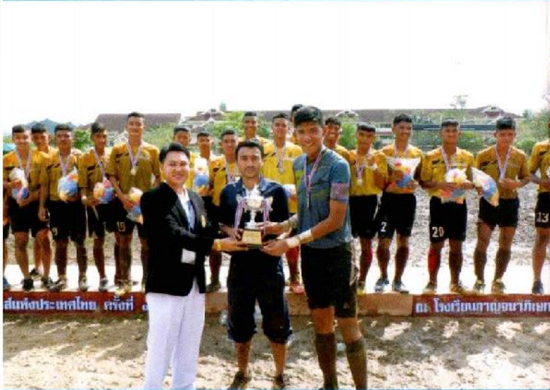
แชมป์กาญจนาเกมส์ครั้งที่ ๑๗

ชนะเลิศกีฬากาญจนาเกมส์แห่งประเทศไทย ครั้งที่ ๑๗ ปี ๒๕๖๐