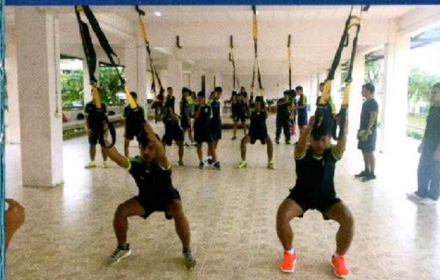
ฝึกและทดสอบพลังกล้ามเนื้อนักฟุตบอลชาย