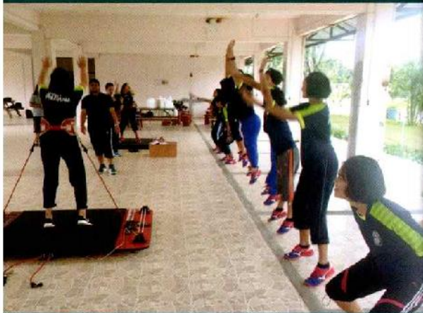
ฝึกและทดสอบพลังกล้ามเนื้อที่กัวลเลซซ์บอลหญิง

ระยะเวลา ๔ เดือนที่ผ่านมา นักเรียน โครงการห้องเรียนกีฬา มีสมรรถนะทางกาย และทักษะทางกีฬาดีขึ้น