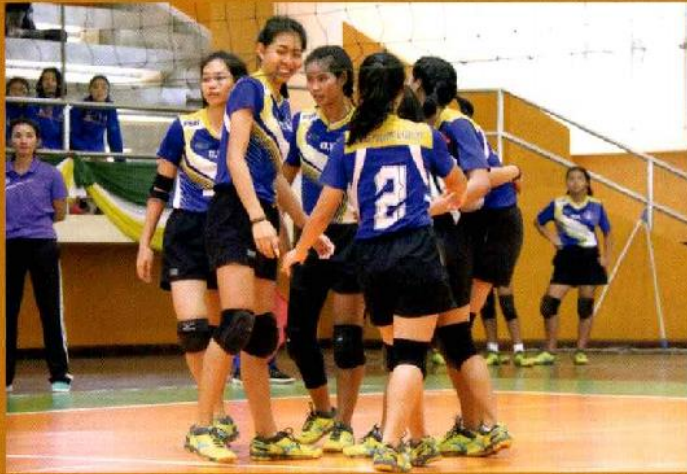
ทีมวอลเลย์บอลหญิงโรงเรียนสุโขทัยวิทยาคม