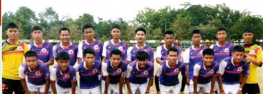
ชนะเลิศ ฟุตบอลชายรุ่นทั่วไปกีฬามัธยมศึกษาสุโขทัยเกมส์ ระหว่างวันที่ ๔ - ๑๑ มกราคม ๒๕๖๐