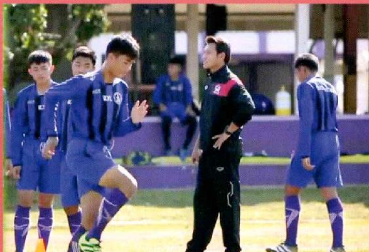
ทีมฟุตบอลโรงเรียนสุโขทัยวิทยาคม ชนะศึกซ้อม เตรียมแข่งขันชิงแชมป์เยาวชน ๑๖ ปี