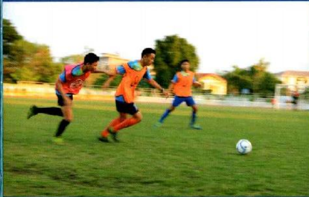
ทดสอบทักษะกีฬาฟุตบอล