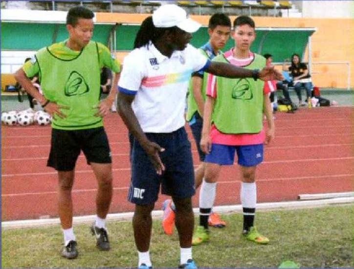
กองเต๋ ไค้ชชาวกีวี สาธิตเทคนิคการเล่นก่อนซ้อม ให้ทีมฟุตบอลโรงเรียนสารคามพิทยาคม

คลินิกพิเศษเป็นการนำนักกีฬาและผู้ฝึกสอนระดับชาติ และนานาชาติ มาฝึกสอน สร้างแรงบันดาลใจและพัฒนาทักษะกีฬาให้นักเรียนทั้งกีฬาฟุตบอลและวอลเลย์บอลเพื่อเสริมทักษะกีฬาให้นักเรียนมีทักษะขั้นสูงเดือนละ ๑ ครั้ง เป็นระยะเวลา ๔ เดือน เน้นการฝึกทักษะพื้นฐานที่ถูกต้อง จนถึงทักษะขั้นสูง