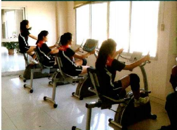
ทดสอบระบบแอโรบิค

ระยะเวลา ๔ เดือนที่ผ่านมา นักเรียน โครงการห้องเรียนกีฬา มีสมรรถนะทางกาย และทักษะทางกีฬาดีขึ้น