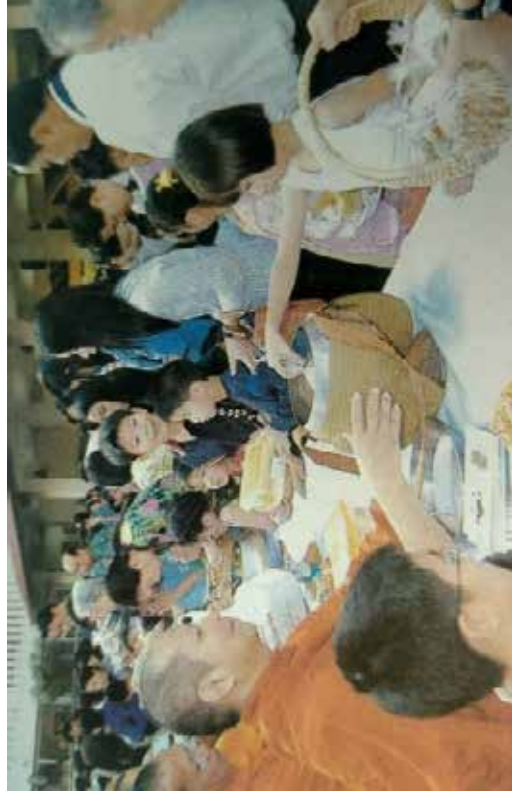
ภาพการทำบุญตักบาตร