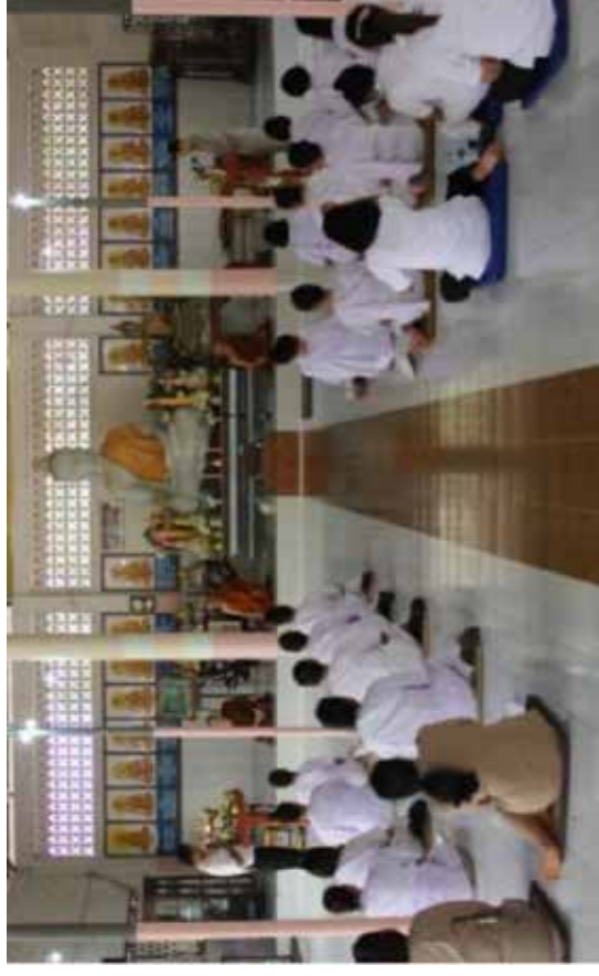
ภาพการเจริญสติภาวนา