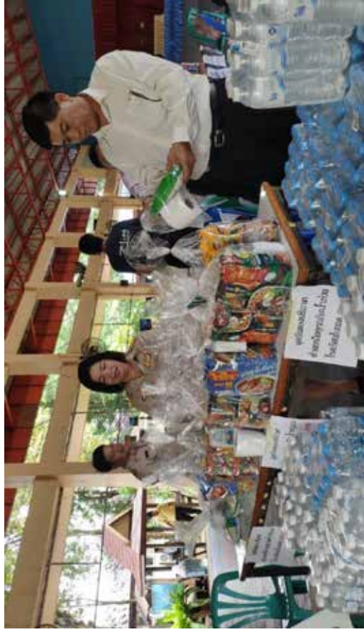
ภาพการบริจาคสิ่งของช่วยเหลือผู้ประสบอุทกภัย