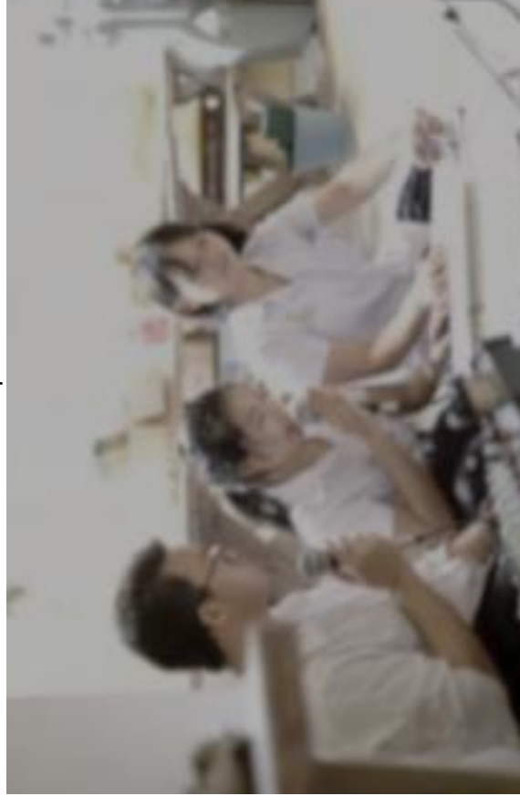
ภาพ ชมรมพุทธศาสตร์

แหล่งที่มา : ชมรมพุทธศาสตร์และประเพณี จุฬาลงกรณ์มหาวิทยาลัย สืบค้น ณ วันที่ : 6 มกราคม 2564