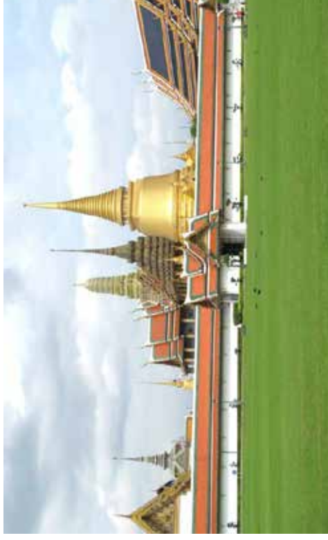
ภาพวัดพระศรีรัตนศาสดาราม (วัดพระแก้ว)