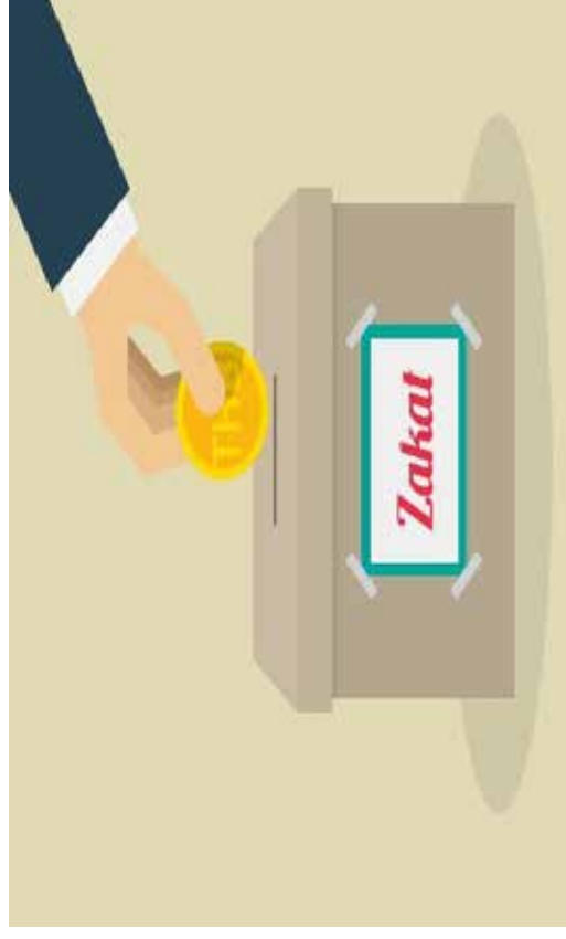
ภาพการบริจาคชะกาต

แหล่งที่มา : http://tpso12.m-society.go.th/ ( https://1th.me/dGOV ) สืบค้น ณ วันที่ : 22 ธันวาคม 2563