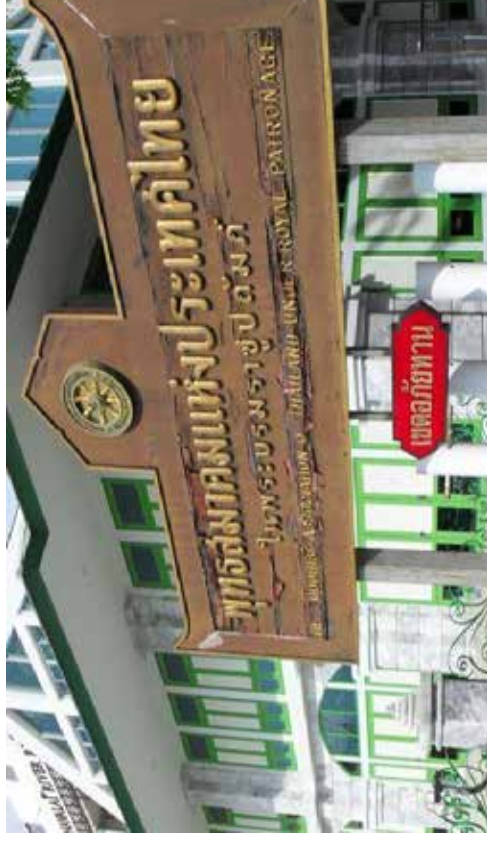
ภาพการรวมกลุ่มพุทธสมาคม