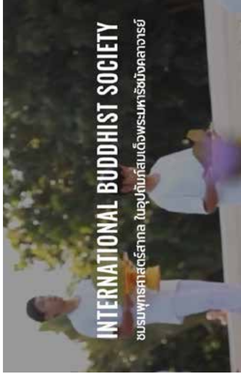
ภาพพุทธศาสน์สากล