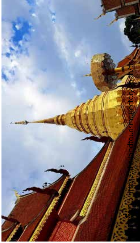
ภาพวัดพระธาตุดอยสุเทพ