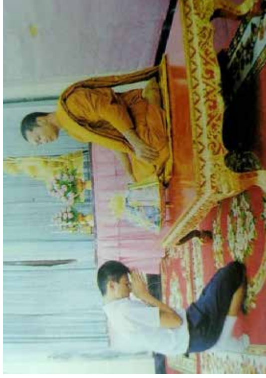
ภาพการไหว้พระ

แหล่งที่มา : หนังสือเรียน รายวิชาพื้นฐาน พระพุทธศาสนา ชั้นมัธยมศึกษาปีที่ ๔ - ๖, หน้า ๓๒๔