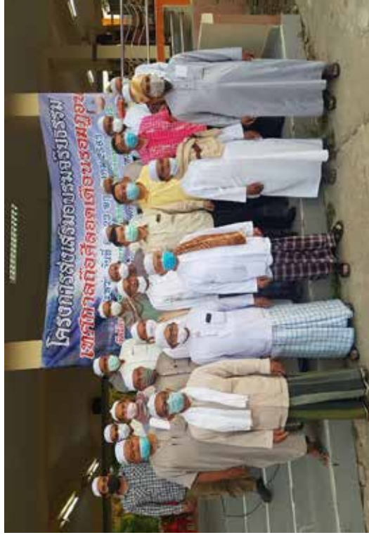
ภาพการถือศีลอด