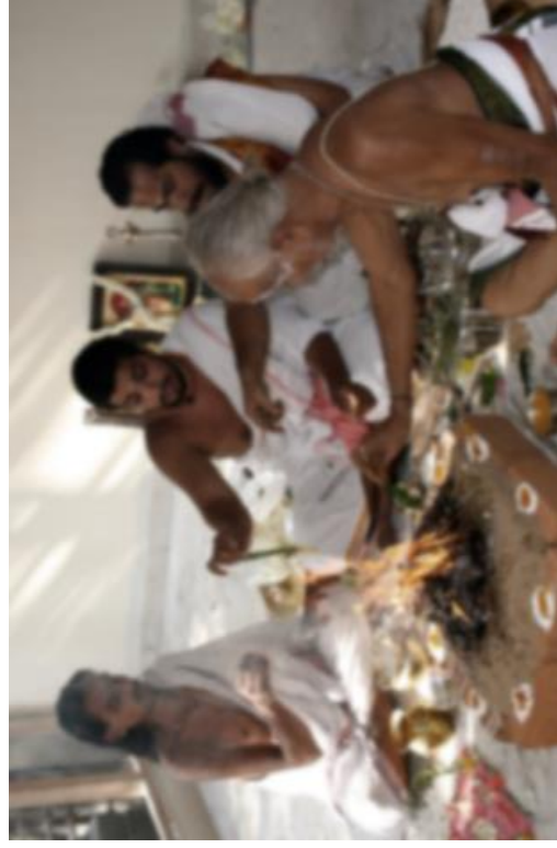
ภาพการทำพิธีสังสการ