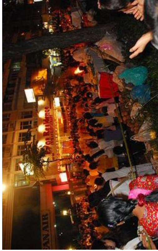
ภาพการบูชาเทพเจ้า