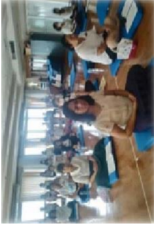
ภาพการเจริญภาวนา