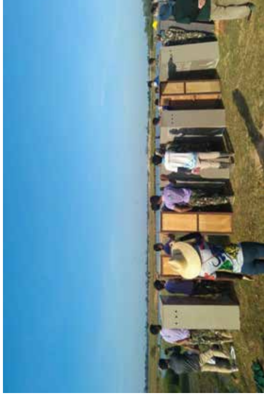
ภาพการทำทาน (ปล่อยนก ปล่อยปลา)

แหล่งที่มา : http://newweb.mnre.go.th/news/detail/88581 สืบค้น ณ วันที่ : ๒๒ ธันวาคม ๒๕๖๓