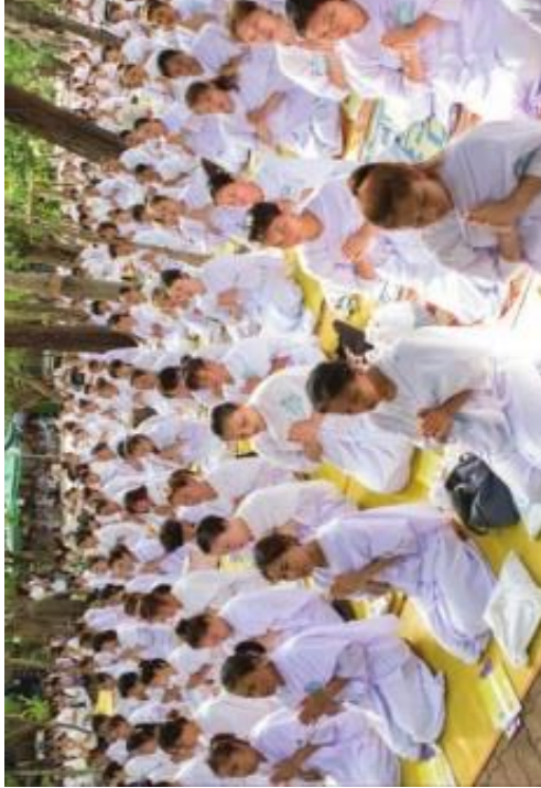
ภาพการสวดมนต์

แหล่งที่มา : https://thaicam.go.th/ ( https://zhort.link/oX ) สืบค้น ณ วันที่ : 5 มกราคม 2564