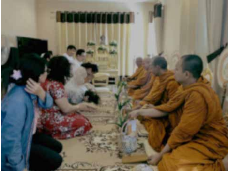
รูปภาพทำบุญขึ้นบ้านใหม่

ที่มา : https://bit.ly/3cX7H6k . ๕ เมษายน ๒๕๖๔