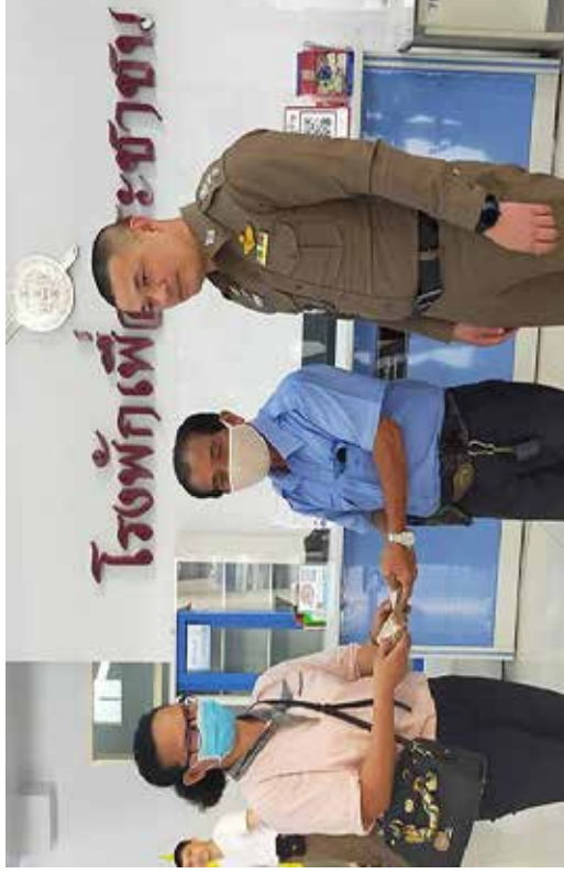
ภาพคนขับแท็กซี่เก็บกระเป๋าสตางค์เงินส่งคืนเจ้าของ