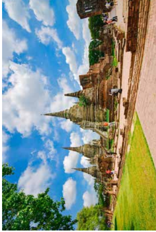
ภาพวัดพระศรีสรรเพชญ์

แหล่งที่มา : https://go.ayutthaya.go.th/wp-content/uploads/2019/06/17739-1024x683.jpg สืบค้น ณ วันที่ : 6 มกราคม 2564