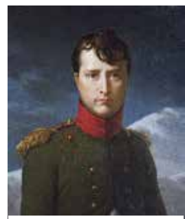
นโปเลียน โบนาปาร์ต

ชาวยุโรปภูมิใจในความเป็นชนผิวขาวที่นับถือศาสนาคริสต์ของตน และคิดว่าพวกตนมีความเหนือกว่าชนชาติอื่นซึ่งแตกต่างจากตนทั้งเชื้อชาติ ศาสนาและวัฒนธรรม พวกเขาเชื่อว่าการช่วยเหลือให้คนเหล่านั้นได้เข้าถึงศรัทธาในพระเจ้าของตนและเรียนรู้อารยธรรมของชาวตะวันตก เป็น “ ภาระของคนผิวขาว (White man's burden) ” และยังเป็นการสร้างกุศลที่ยิ่งใหญ่ให้กับผู้เผยแผ่ศาสนาด้วย ดังนั้นมิชชันนารีชาวยุโรปจำนวนมากจึงยินดีอุทิศตนทำงานช่วยเหลือชาวพื้นเมืองควบคู่กับการเผยแผ่ศาสนาในดินแดนที่ห่างไกล ความเจริญ ทั้งในเอเชียและแอฟริกา