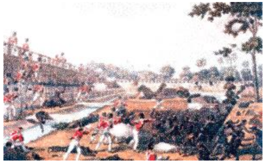
กองทัพอังกฤษเข้าโจมตีพม่า

ในคริสต์ศตวรรษที่ ๑๙ ประเทศตะวันตกได้ขยายลัทธิจักรวรรดินิยมอย่างกว้างขวาง โดยเฉพาะในเอเชียและแอฟริกา เป็นที่น่าสังเกตว่านอกจากอังกฤษและฝรั่งเศสซึ่งได้ครอบครองดินแดนอาณานิคมมาตั้งแต่คริสต์ศตวรรษที่ ๑๗ แล้ว ประเทศที่มีบทบาทขยายอำนาจในขณะนั้นต่างต้องการพัฒนาเป็นจักรวรรดิที่ยิ่งใหญ่ จึงขยายลัทธิจักรวรรดินิยมเพื่อสร้างฐานอำนาจทางเศรษฐกิจและการเมืองที่มั่นคง