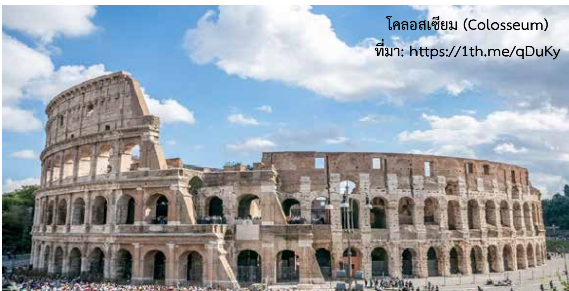
โคลอสเซียม (Colosseum)

อารยธรรมโรมันมีความเจริญก้าวหน้าทั้งทางด้านวิทยาศาสตร์และวิศวกรรม มีการสร้างอาคารสาธารณะต่าง ๆ เพื่อสนองความต้องการของรัฐและประโยชน์ใช้สอยของสาธารณชน เช่น โรงมหรสพขนาดใหญ่ที่เรียกว่า โคลอสเซียม (Colosseum) เพื่อการพักผ่อนหย่อนใจของประชาชน เช่น เป็นที่แสดงกีฬาสู้กับสิงโต สถานที่อาบน้ำสาธารณะเพื่อเป็นที่พบปะสังสรรค์ ออกกำลังกาย เป็นต้น นอกจากนี้ ชาวโรมันได้สร้างกฎหมายฉบับแรกของยุโรป เรียกว่า กฎหมายสิบสองโต๊ะ (The Code of the Twelve Tables) ซึ่งเป็นแม่บทกฎหมายของประเทศต่าง ๆ ในยุโรป ต่อมาประมาณ ๖๐ ปีก่อนคริสต์ศักราช ศาสนาคริสต์ได้ถือกำเนิดขึ้นในดินแดนปาเลสไตน์ แต่ถูกชาวโรมันปราบปราม จนกระทั่งถึง ค.ศ. ๓๑๓ จักรพรรดิคอนสแตนติน (Constantine) ทรงให้เสรีภาพในการนับถือศาสนาแก่ชาวโรมันและพระองค์ก็ทรงนับถือศาสนาคริสต์ด้วย ทำให้ในเวลาต่อมาศาสนาคริสต์กลายเป็นศาสนาประจำชาติของจักรวรรดิโรมันและเผยแผ่ไปยังดินแดนต่าง ๆ ของจักรวรรดิโรมัน และเมื่อคริสต์ศตวรรษที่ ๕ จักรวรรดิโรมันเริ่มเสื่อมลงและถูกชนเผ่าเยอรมันเข้ามารุกราน ในที่สุดชนเผ่าเยอรมันก็ยึดกรุงโรมได้เมื่อ ค.ศ. ๔๗๖ นับเป็นการสิ้นสุดสมัยโบราณ