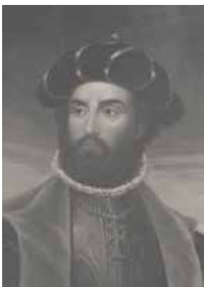
วาสโก ดา กามา