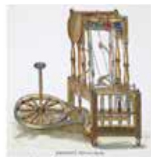
เครื่องจักรไอน้ำ

การพัฒนาของอุตสาหกรรมประเภทอื่น การประดิษฐ์เครื่องจักรไอน้ำและเครื่องจักรประเภทอื่นที่เกิดขึ้นตามมา ทำให้มีความต้องการใช้ แร่เหล็ก ซึ่งเป็นวัสดุสำคัญในการสร้างเครื่องจักรกลเพิ่มมากขึ้น ส่งผลให้เกิดอุตสาหกรรมเหมืองแร่และอุตสาหกรรมถ่านหินซึ่งเป็นพลังงานที่ใช้กันแพร่หลายในคริสต์ศตวรรษที่ ๑๙ เนื่องจากขณะนั้น