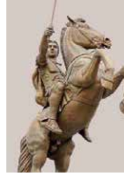
พระเจ้าอเล็กซานเดอร์มหาราช ที่มา: หนังสือส่งเสริมประสิทธิภาพการเรียนรู้ กลุ่มสาระการเรียนรู้สังคมศึกษา ศาสนา และวัฒนธรรม, หน้า ๑๔๕

อารยธรรมกรีกเป็นอารยธรรมที่เจริญอยู่ในคาบสมุทรกรีกโดยมีพัฒนาการมาตั้งแต่ ๑๒๐๐-๘๐๐ ปีก่อนคริสต์ศักราช กรีกมีรูปแบบการปกครองเป็นนครรัฐหรืออะโครโพลิส (Acropolis) แต่ละนครรัฐจะมีอิสระทางการเมือง นครรัฐที่สำคัญของกรีก ได้แก่ เอเธนส์ สปาร์ตา และมาซิโดเนีย โดยเอเธนส์เป็นนครรัฐที่เป็นต้นกำเนิดการปกครองแบบประชาธิปไตย นครรัฐสปาร์ตาเป็นรัฐทหารที่มีระเบียบวินัยเข้มงวด รัฐมีอำนาจเด็ดขาดในการกำกับดูแลประชาชนอย่างใกล้ชิด ส่วนนครรัฐมาซิโดเนียเป็นรัฐทหารที่เชี่ยวชาญในการรบสามารถขยายอาณาเขตเข้ามาถึงตอนเหนือของอินเดียได้ในช่วงประมาณ ๓๓๔-๓๒๖ ปีก่อนคริสต์ศักราช