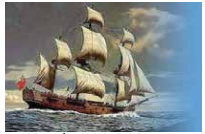
ที่มา : หนังสือส่งเสริมประสิทธิภาพ การเรียนรู้กลุ่มสาระการเรียนรู้ สังคมศึกษา ศาสนา และวัฒนธรรม หน้า ๑๔๘

๑) การมีวิทยาการที่ก้าวหน้า การศึกษาในสมัยฟื้นฟูศิลปวิทยาการผลักดันให้ชาวยุโรปหันมาสนใจต่อท้องทะเลที่กั้นระหว่างโลกตะวันออกกับโลกตะวันตก นอกจากนี้ความรู้ในการใช้เข็มทิศ การพัฒนารูปทรงและขนาดของเรือให้แข็งแรงทนทานต่อสภาพลมฟ้าอากาศ สามารถที่จะเดินทางไกลได้ดีขึ้น ทำให้ชาติตะวันตกหลังไหลสู่โลกตะวันออกอย่างกว้างขวาง