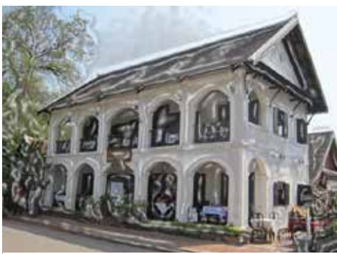
บ้านเรือนที่ได้รับอิทธิพลจากฝรั่งเศสในลาว

หลังจากที่ชาติมหาอำนาจทำการยึดครองดินแดนแล้ว ชาติมหาอำนาจจะปกครองดินแดนเหล่านี้ในลักษณะอาณานิคม คือ นำชาวต่างชาติเข้ามาเป็นผู้ปกครองแทนชาวพื้นเมืองและพยายามกดขี่ชาวพื้นเมืองให้กลายเป็นพลเมืองชั้นสอง นอกจากนี้ชาติมหาอำนาจมักจะใช้ดินแดนอาณานิคมเป็นแหล่งวัตถุดิบและตลาดของสินค้าที่ตนผลิตขึ้น เช่น การนำชาเข้าไปปลูกยังอินเดียและศรีลังกาของอังกฤษ การทำเหมืองแร่ในแอฟริกา และในขณะเดียวกันชาติมหาอำนาจก็ได้พัฒนาดินแดนเหล่านี้ให้มีความเจริญแบบตะวันตก ด้าน เช่น