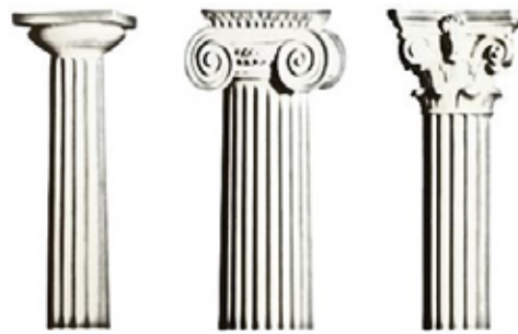
รูปแบบสถาปัตยกรรมของกรีก