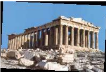
มหาวิหารพาร์เธนอน

กรีกเป็นชนชาติที่เห็นความสำคัญของมนุษย์ว่าสามารถคิดอย่างมีเหตุผลได้ จึงมีแนวคิดปรัชญาที่เน้นคุณค่าของความเป็นมนุษย์ หรือเรียกว่า มนุษยนิยม โดยมีนักปรัชญาคนสำคัญเช่น โซเครตีส (Socrates) เพลโต (Plato) อริสโตเติล (Aristotle) เป็นต้น กรีกมีความเจริญก้าวหน้าทางด้านวิชาการสาขาต่าง ๆ เช่น คณิตศาสตร์ ดาราศาสตร์ การแพทย์ การศึกษา การค้าทางทะเล ศิลปกรรม สถาปัตยกรรม เป็นต้น ทั้งนี้อารยธรรมกรีกได้แพร่หลายไปยังดินแดนรอบทะเลเมดิเตอร์เรเนียนถึงตอนเหนือของแอฟริกา เปอร์เซีย และอินเดีย