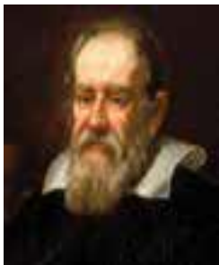
กาลิเลโอ กาลิเลอี

๑) นิโคลาส โคเปอร์นิคัส (Nicholas Copernicus) ชาวโปแลนด์ เสนอทฤษฎีว่าดวงอาทิตย์เป็นศูนย์กลางของจักรวาล โดยมีดาวเคราะห์รวมทั้งโลกหมุนรอบดวงอาทิตย์ ทฤษฎีของเขาล้มล้างความเชื่อของคนในสมัยโบราณและสมัยกลางที่ยึดถือข้อสมมติฐานของอริสโตเติล (Aristotle) และงานเขียนของปโตเลมี (Ptolemy) ที่อธิบายว่า โลกเป็นศูนย์กลางของจักรวาล